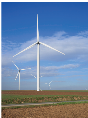
Fortel en Artois

Pendant, la société InnoVent considère que cet argument n'a que très peu de poids. L'esthétisme des éoliennes dans le paysage ne nous paraît pas être un critère recevable pour le refus d'un parc éolien.