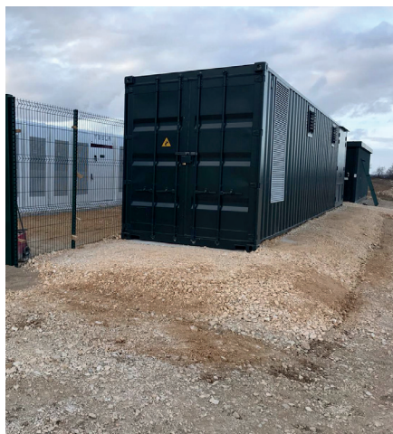
Parc de batteries d'Essey-les-Ponts. (52)